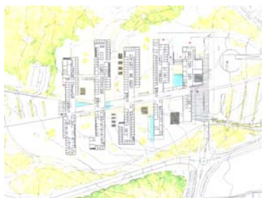
Follo regionsykehus Konkurransen