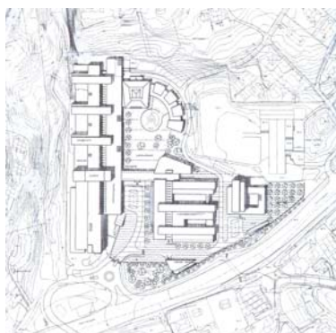
Det norske radiumhospital Konkurransen