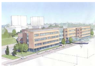
Ullevål universitetssykehus Kreft- og isolatsenter